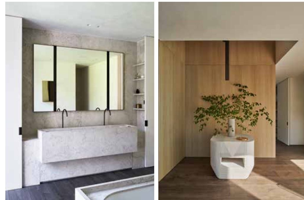
Met de klok mee vanaf boven Het raam bij de zithoek biedt een groots uitzicht op de tuin, in de hal een console van Rick Owens, vaas van Nicolas Schuybroek voor When Objects Work en messing sleutelhouder van Vincent Van Duysen, badkamer van natuursteen met eikenhouten vloer Linkerpagina Marmereen keuken van Obumex met vintage Pierre Jeanneret-stoelen