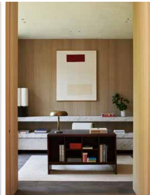
Met de klok mee vanaf linksboven Trap en wanden van eikenhout, een opvallend kunstwerk in de zitkamer, studeerkamer met bureau van Pierre Jeanneret, de bewoners Linkerpagina Eikenhouten tafel van When Objects Work, eikenhouten stoelen van Bassam